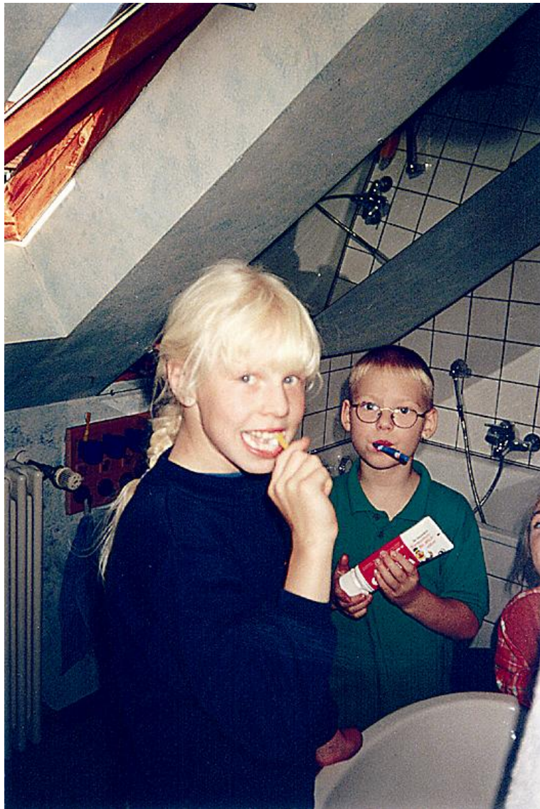
Foto: DRK – nach dem Essen Zähne putzen nicht vergessen – DRK Kindertagesstätte Lummerland

Qualitätsmanagement in der Hauswirtschaft (siehe Kapitel 7)