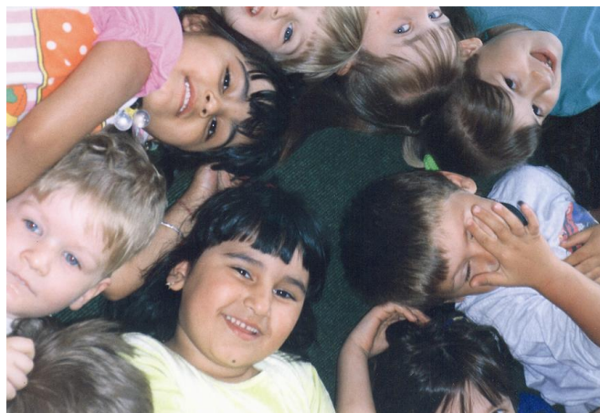
Kinder der DRK Kindertagesstätte Heideblümchen

Eltern, Kindertagesstätten und Umwelt stehen in einem Dreieck zueinander in dessen Mitte sich das Kind befindet. Wir wollen Eltern in die Entwicklungsprozesse ihrer Kinder einbeziehen und ihnen Möglichkeiten der aktiven Beteiligung im Kindergartenalltag bieten. Die gemeinsame Parteinahme für die Interessen der Kinder im sozialen und politischen Raum ist uns ein wichtiges Anliegen. Somit ist die pädagogische Arbeit in Kindertagesstätten immer auch ein Entwicklungsprozess in Reflektion der gesellschaftlichen Veränderungen, dessen Fachlichkeit wir durch das Qualitätsmanagement absichern.