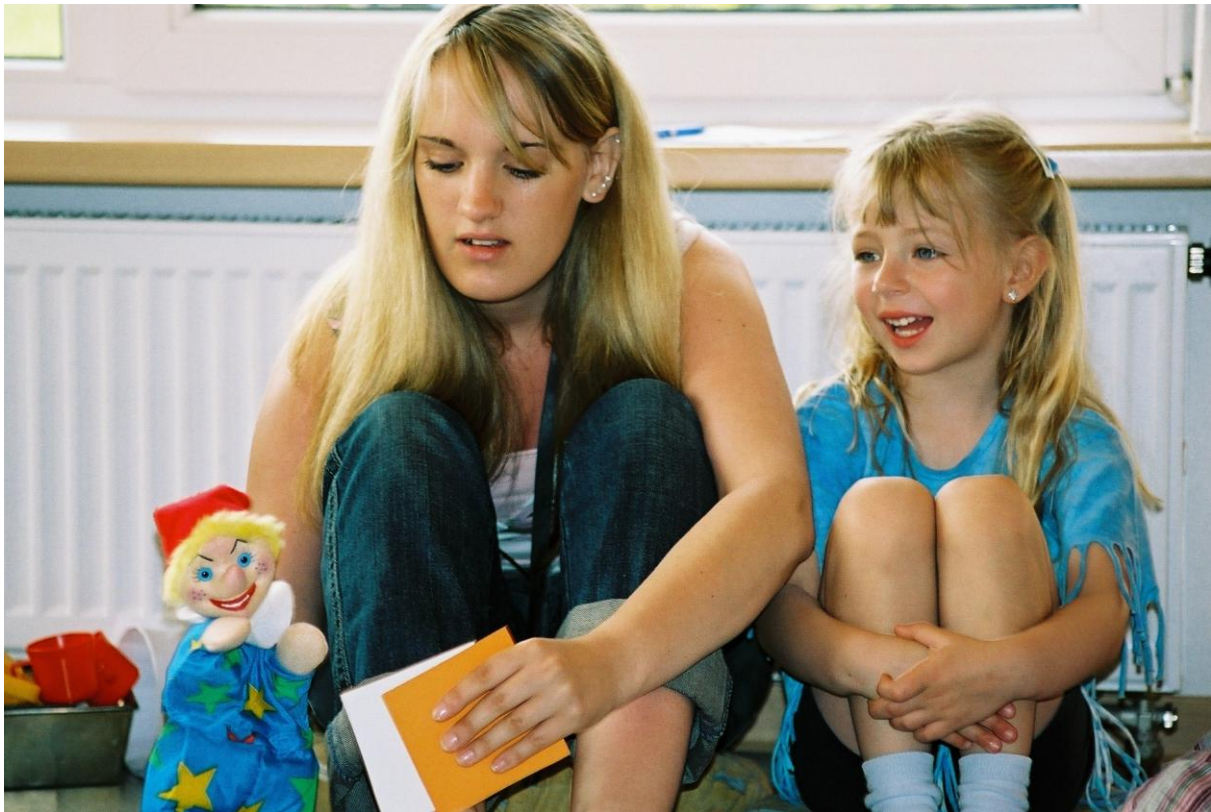
Die Erzieherin spricht durch den Kasper – DRK Kindertagesstätte Nestwerk