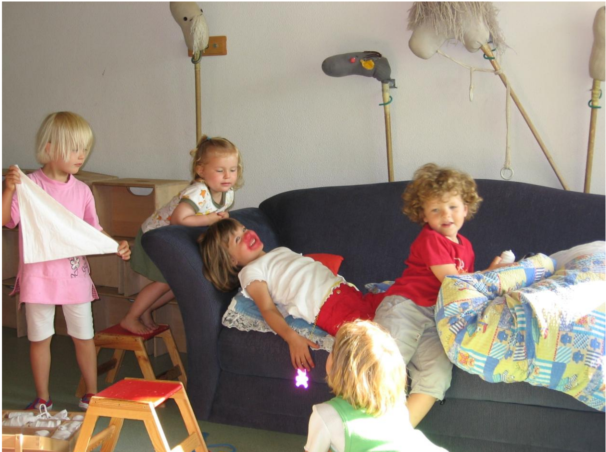
„Arzt und Patient“ Rollenspiel in der Kindertagesstätte Nestwerk