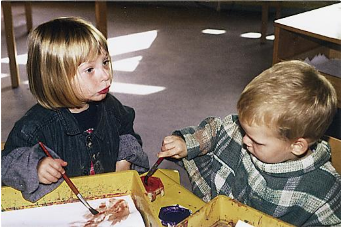
Volle Konzentration beim Malen – DRK Kindertagesstätte Mehlhausen

Außerdem stehen den Kindern Brett – und Kartenspiele zur Verfügung. Hierfür können sie sich ihre Mitspieler selbst aussuchen.