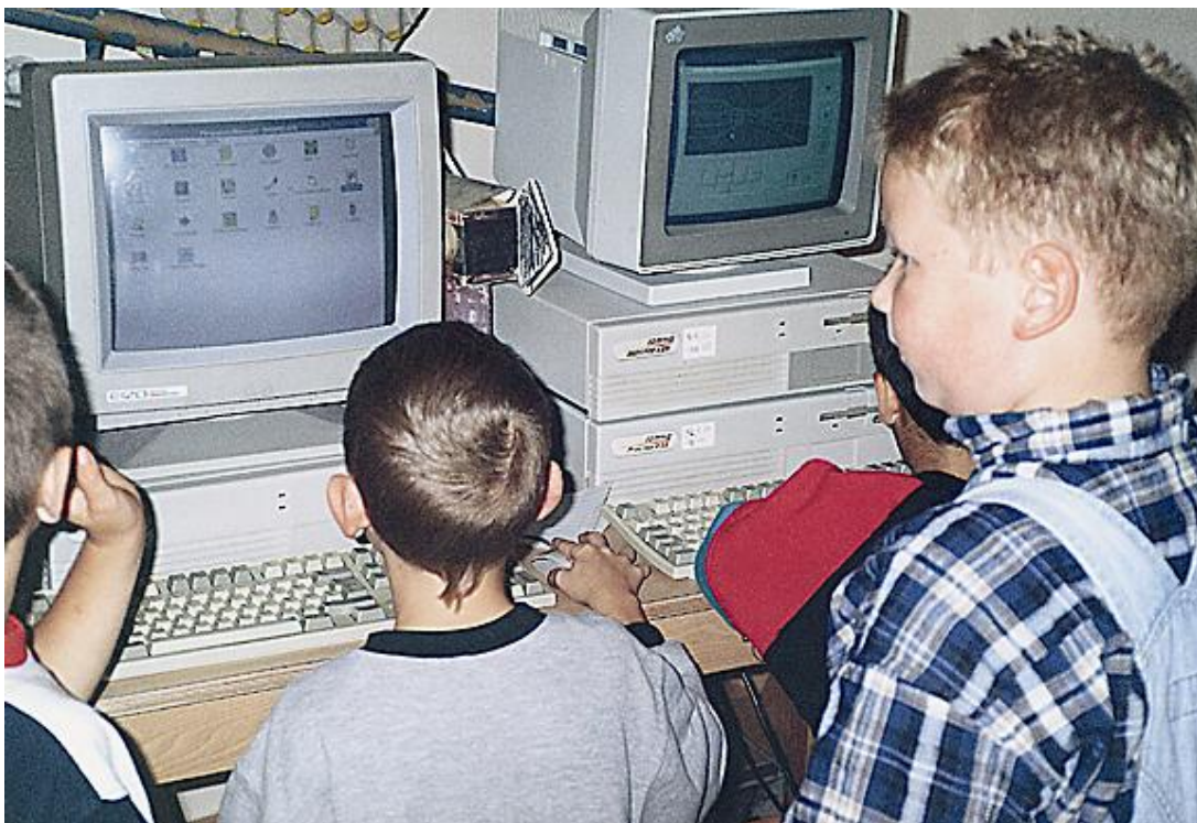
Sinnvoller Umgang mit Medien muss geübt werden – DRK Kindertagesstätte Heideblümchen

Im Bewegungsraum wird der Weg einer E-Mail nach gebaut und als Geschicklichkeitsparcours bewältigt.