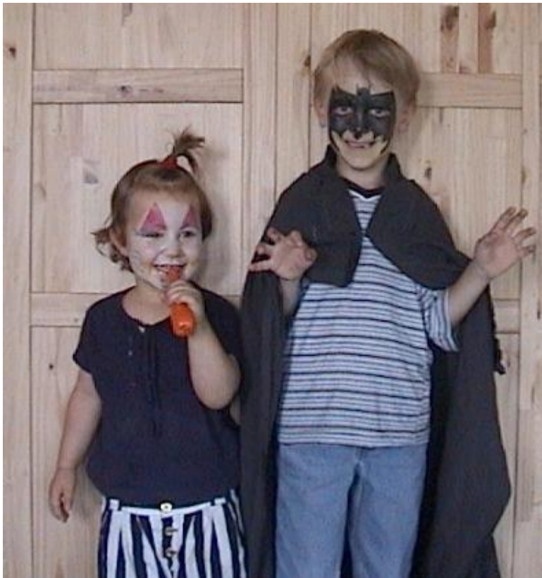
Fasching feiern in der DRK Kindertagesstätte Nestwerk