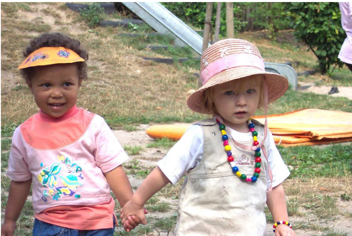
Freundschaften entwickeln sich – DRK Kindertagesstätte Weltweit