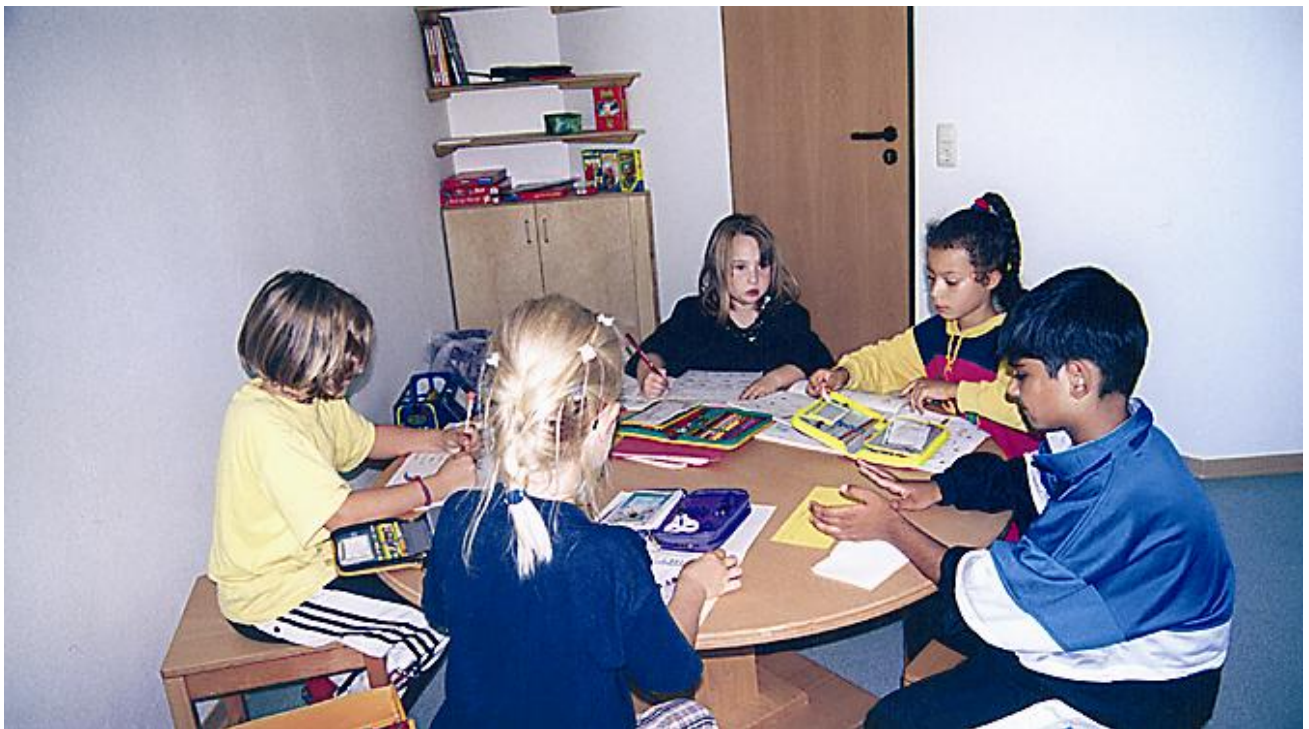
Konzentriert bei den Hausaufgaben in der DRK Kindertagesstätte Nestwerk

Symbole u. gesprochene Worte begleiten die Kinder durch den Alltag. Sie geben Orientierung und dienen der Verständigung.