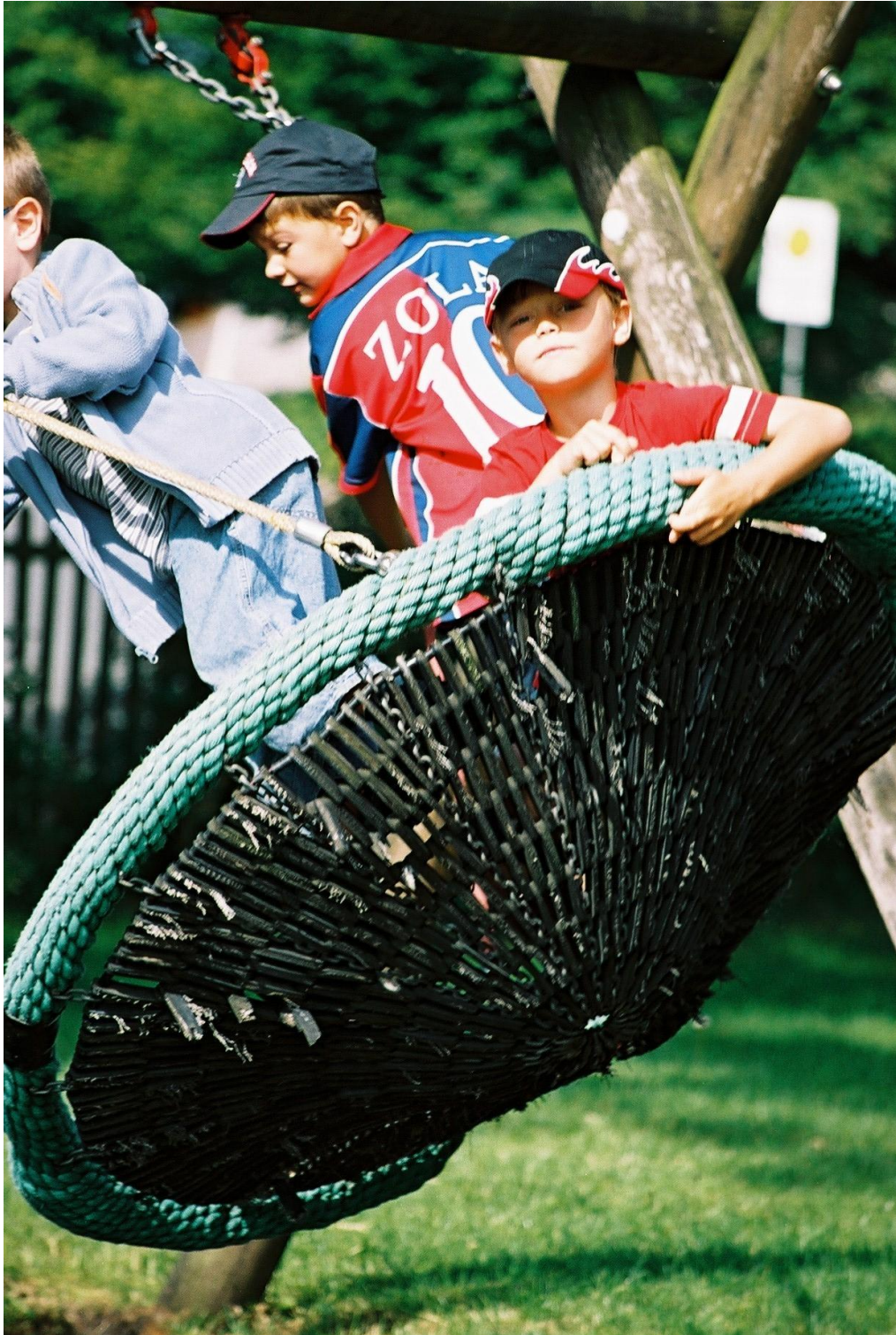
Gemeinsam Schwung holen – DRK Kindertagesstätte Nestwerk

Die Erzieher achten darauf, dass Bewegung und rhythmisches Sprechen miteinander kombiniert werden und dass die Bewegungsabläufe differenziert erfolgen. Anspannung und Entspannung sind ausgewogen. Kinder bewegen sich ausgelassen, schnell und raumgreifend, kommen aber auch zu behutsamen und feinmotorischen Bewegungen. Sie können zwischen „laut“ und „leise“ wechseln.